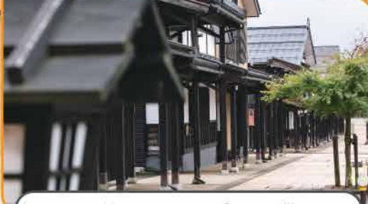
江戸時代にタイムスリップしたかのような 雪国特有の雁木が美しい街並みを散策いただけます。